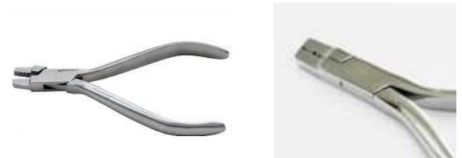
15. Torre para contorneamento de arco com uma haste